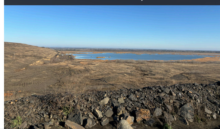
Almacenamiento de relaves en el sitio del Proyecto North Met.

Al asociarse con las comunidades locales y mantener un enfoque en la minería responsable, el sector minero de Minnesota puede continuar creciendo mientras ayuda a satisfacer la demanda nacional de minerales críticos. El futuro de la minería en el Iron Range no se trata sólo de oportunidades económicas, sino también de desarrollo sostenible y del fortalecimiento de la fuerza laboral de la región para los años venideros.