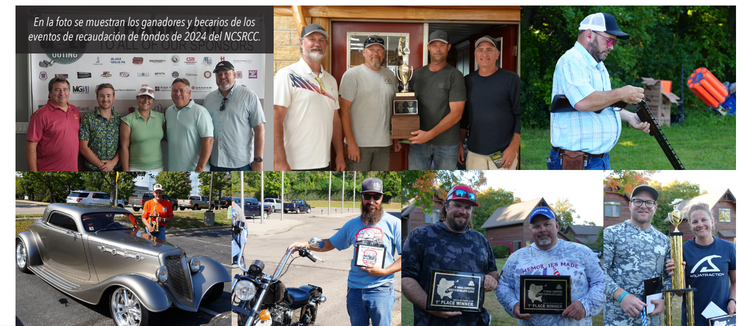
En la foto se muestran los ganadores y becarios de los eventos de recaudación de fondos de 2024 del NCSRCC.

Para fotos y actualizaciones del evento, siga la página de Facebook de nuestro consejo.