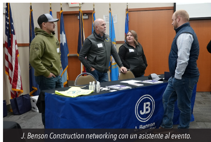
J. Benson Construction networking con un asistente al evento.

cara a cara con los actores clave son escasas. Al reunir a varias empresas propiedad de minorías y mujeres en un solo espacio, el evento permitió que los contratistas generales más grandes conocieran a posibles socios.