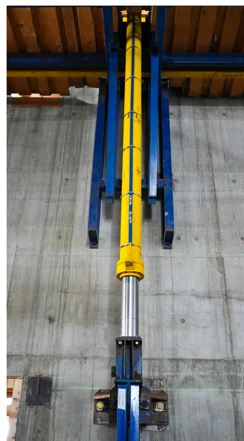
Uno de los dieciocho cilindros hidráulicos DOKA Shear Core Climber.

y es el segundo escalador más grande que se haya construido en los EE. UU. Proporciona un ciclo seguro y repetitivo para que los carpinteros sindicalizados preparen, viertan y erijan el núcleo del edificio. Para garantizar que los componentes del sistema estén siempre en buen estado de funcionamiento, un representante de DOKA está en el lugar todas las semanas.