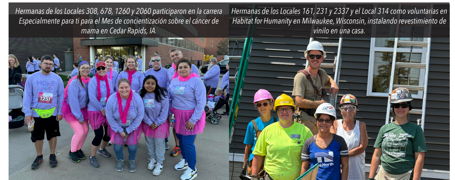
Hermanas de los Locales 308, 678, 1260 y 2060 participaron en la carrera Especialmente para ti para el Mes de concientización sobre el cáncer de mama en Cedar Rapids, IA.

El trabajo de las Hermanas de la Hermandad es vital para dar forma a una industria de la construcción más inclusiva y empoderadora.