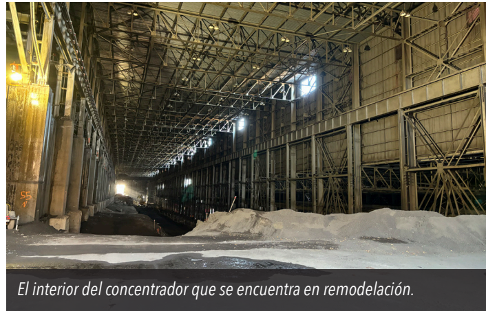
El interior del concentrador que se encuentra en remodelación.

En el norte de Minnesota, la minería ha ocurrido en el área durante los últimos 140 años. NewRange Copper Nickel es una empresa que espera seguir minando en el área. NewRange es una empresa minera de minerales críticos ubicada en la región de Iron Range, en el noreste de Minnesota, con objetivos de avanzar en el legado de la minería, fortalecer la seguridad energética de EE. UU. y apoyar una transición a la energía limpia.