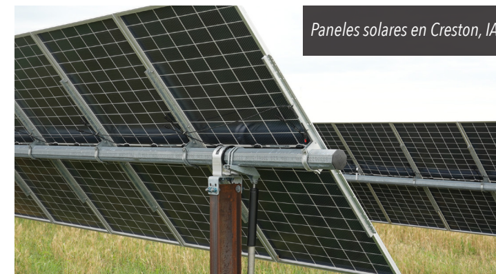
Paneles solares en Creston, IA.