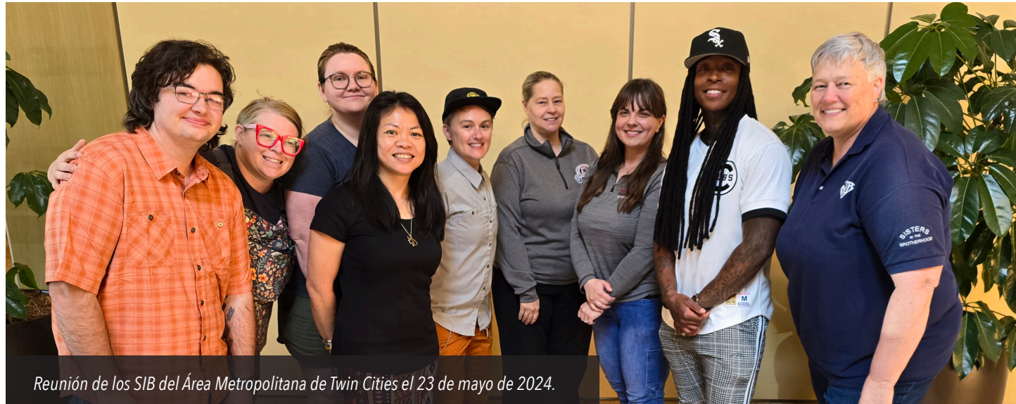
Reunión de los SIB del Área Metropolitana de Twin Cities el 23 de mayo de 2024.

El Consejo Regional de Carpinteros de los Estados del Centro Norte (NCSRCC, por sus siglas en inglés) apoya con orgullo a los comités de las Hermanas de la Hermandad (SIB, por sus siglas en inglés), que proporcionan una red vital para las mujeres en los oficios. Centrados en el reclutamiento, la retención, la educación, la defensa política y la participación pública, estos comités están impulsando el cambio y construyendo un grupo donde las mujeres pueden conectarse, aprender y crecer en la industria de la construcción.