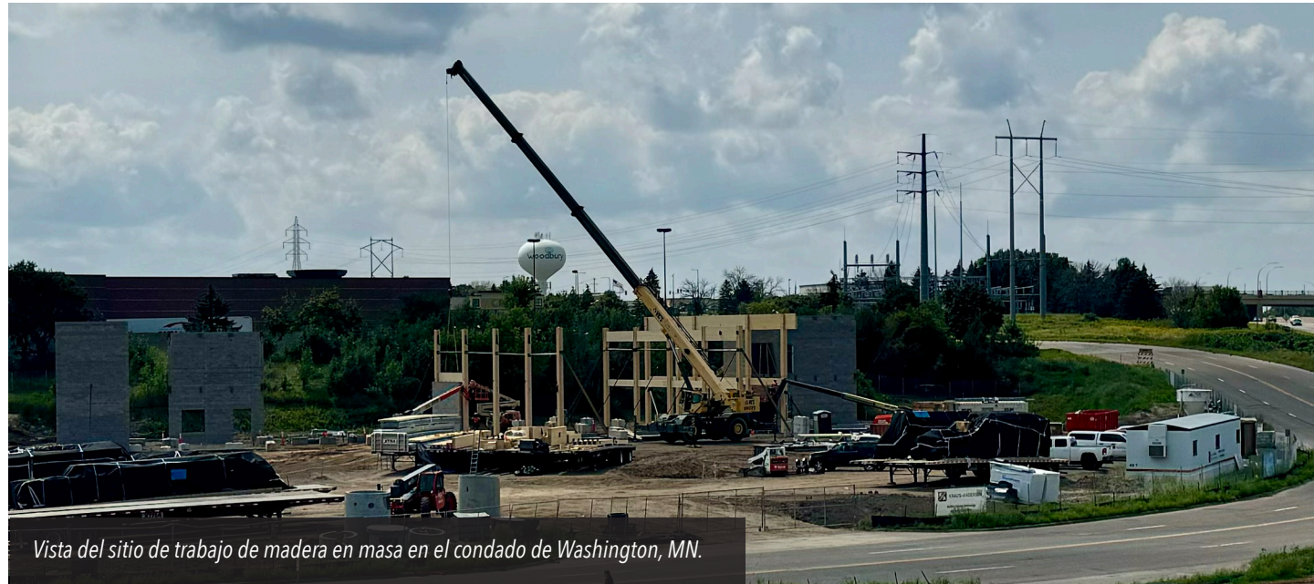
Vista del sitio de trabajo de madera en masa en el condado de Washington, MN.