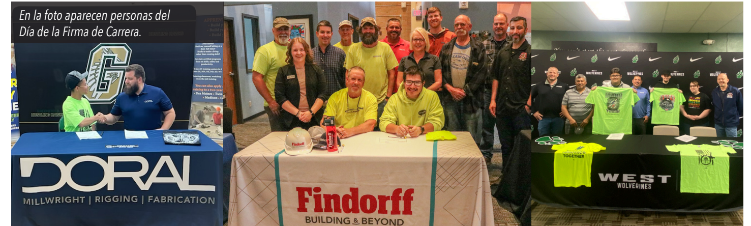
En la foto aparecen personas del Día de la Firma de Carrera.

Los eventos del Día de Firma de Carreras también sirven como un recordatorio para las escuelas secundarias locales del valor que los programas de oficios calificados brindan a sus estudiantes. Estos programas brindan una opción de