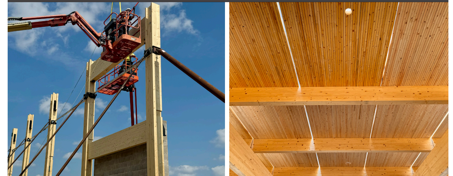
Miembros que trabajan en la construcción de la estructura de madera maciza para el centro de servicios en el condado de Washington, MN.