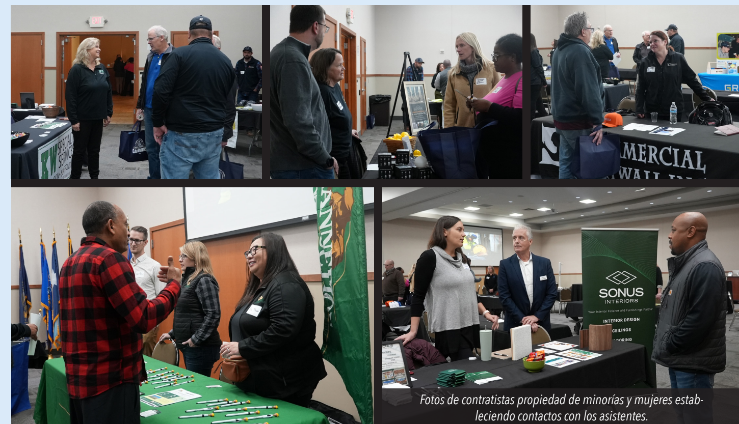
Fotos de contratistas propiedad de minorías y mujeres estableciendo contactos con los asistentes.

Este evento es solo el comienzo. Al continuar organizando iniciativas como esta y ofreciendo recursos que empoderan a los contratistas para que logren sus objetivos, NCSRCC se asegura de que los contratistas propiedad de minorías y mujeres no solo sobrevivan, sino que prosperen en la competitiva industria de la construcción. Juntos, al valorar la diversidad y fomentar el avance equitativo, la industria de la construcción puede ser más inclusiva, innovadora y colaborativa.