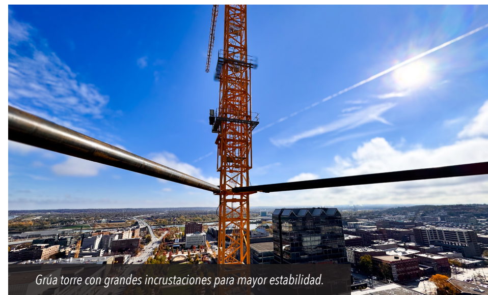
Grúa torre con grandes incrustaciones para mayor estabilidad.